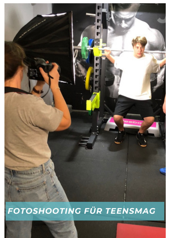
FOTOSHOOTING FÜR TEENSMAG

Dabei bin ich immer wieder selbst erstaunt, wie bunt der Blumenstrauß ist, aus dem sich meine musikmissionarische Arbeit zusammensetzt: Von Radiobeiträgen für die evangelische Kirche in WDR 1 Live über Liedübersetzungen bis hin zu Fotostories für die Teensmag, einer christlichen Jugendzeitschrift. Schon seit rund 15 Jahren bin ich hier im Redaktionsteam tätig. Neben etlichen, oftmals theologischen Artikeln darf ich seit einigen Jahren zweimal jährlich eine Foto-Story entwerfen und so auf sehr unterhaltsame und einfache Weise Inhalte transportieren. Auch in der aktuellen Dezemberausgabe findet sich eine spannende Geschichte über einen Teeny, dem es schwerfällt, auf dem jährlichen Weihnachts-Familienfoto ein glückliches Gesicht zu machen.